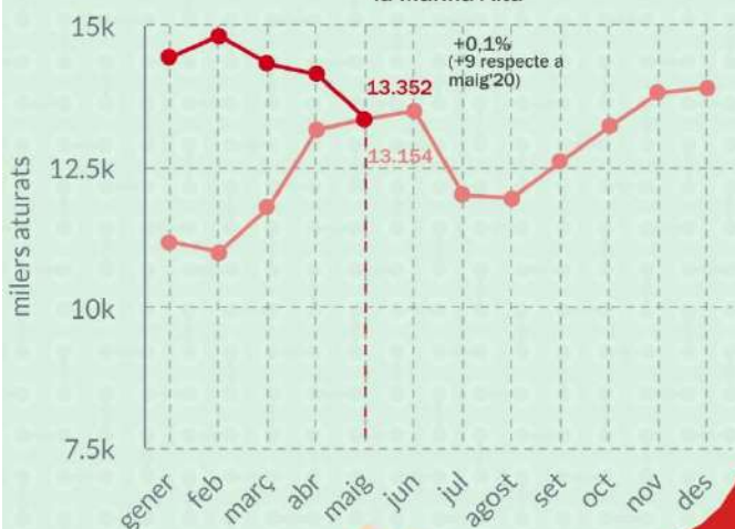
Evolució mensual del núm. de demandants d'ocupació a la Marina Alta