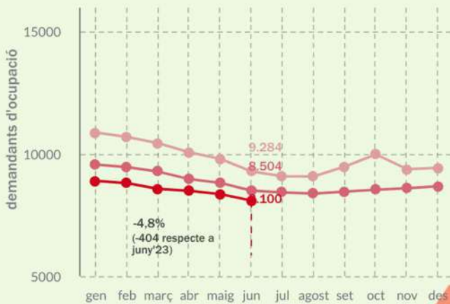
Evolució mensual del nombre de demandants d'ocupació a la Marina Alta