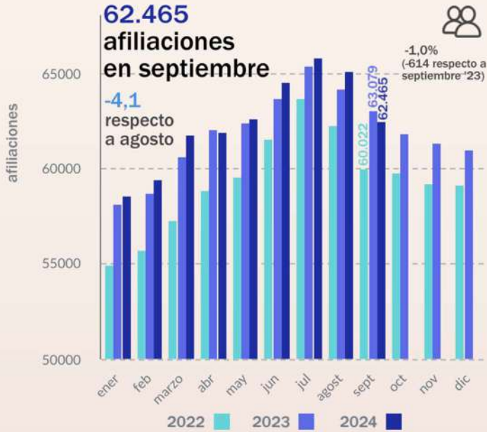
Evolución mensual del núm. de personas afiliadas a la Seguridad Social en la Marina Alta