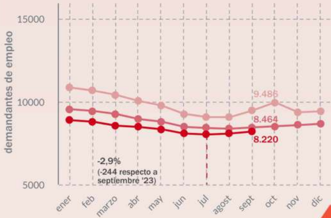
Evolución mensual del núm. de demandantes de empleo en la Marina Alta